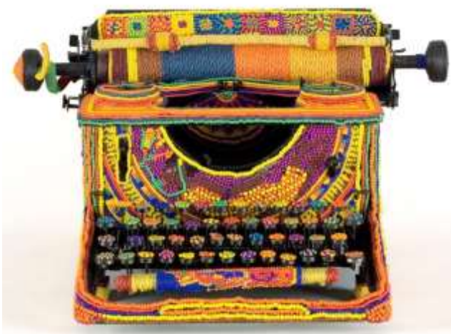
Machine à écrire