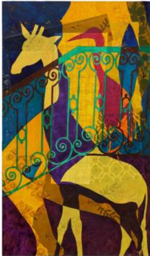
Fragment de la maison des songes

Rencontre avec l'artiste le samedi 1 er juin