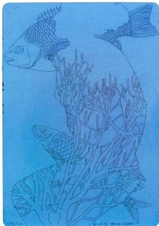
LES PIEDS SUR LA TABLE 41