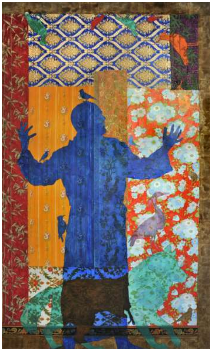
Saint François, le Loup et les Oiseaux