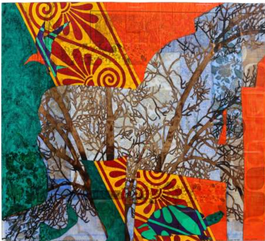
FRAGMENT DE LA MAISON DES SONGES17