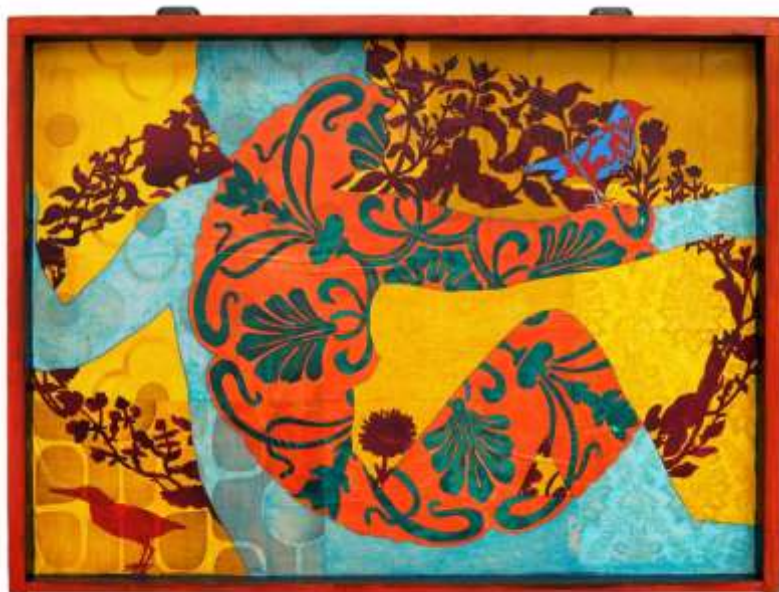
FRAGMENT DE LA MAISON DES SONGES18