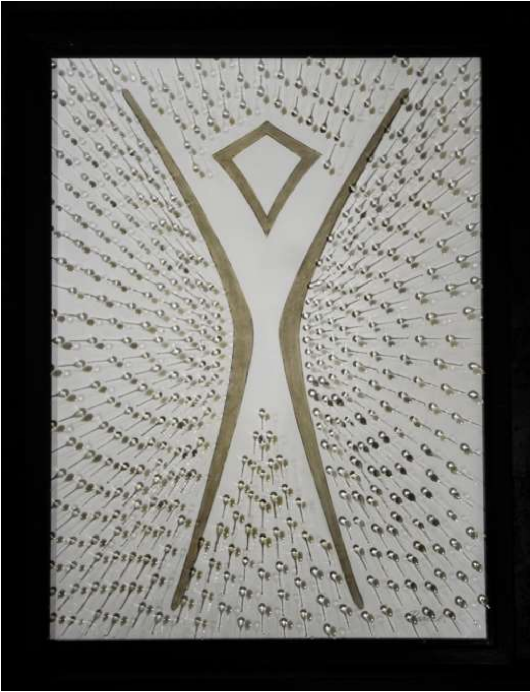
Burning man - 2018 - 80x60 cm