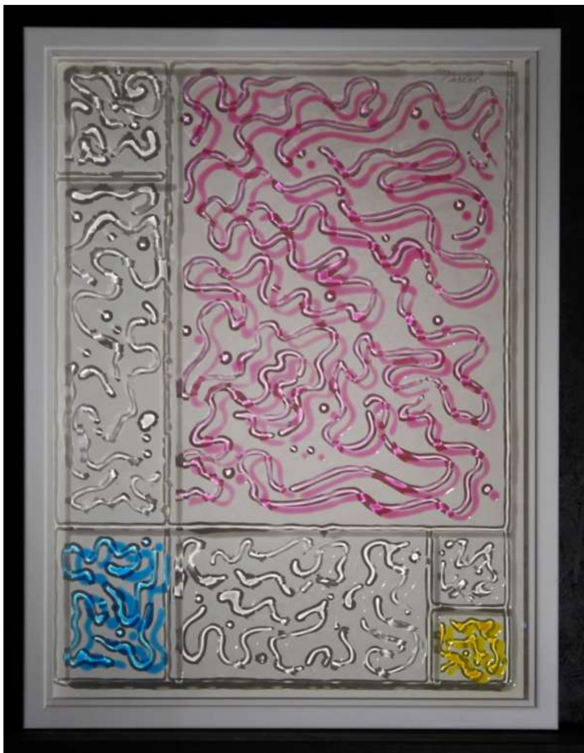
Hommage à Piet - 80 x 60 cm - 2019