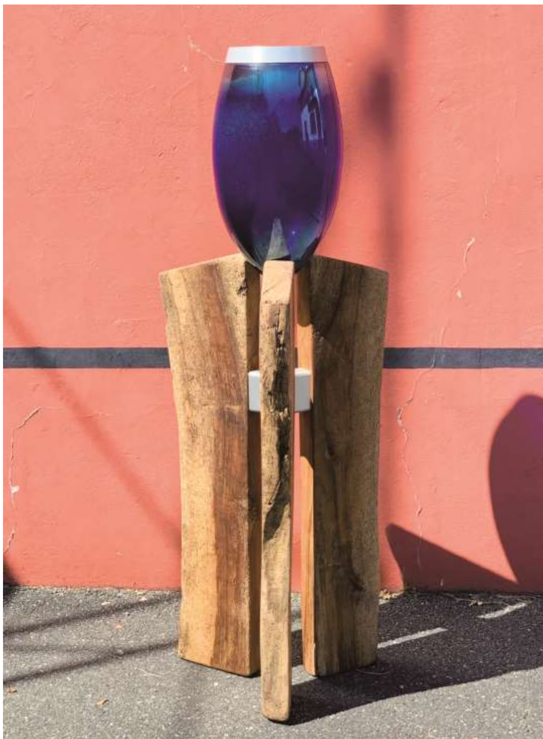
Grand « Cadutaire » II – 2020

Trépied en noyer et aluminium surmonté d'un vase soufflé d'aspect irisé – 130x40x40cm