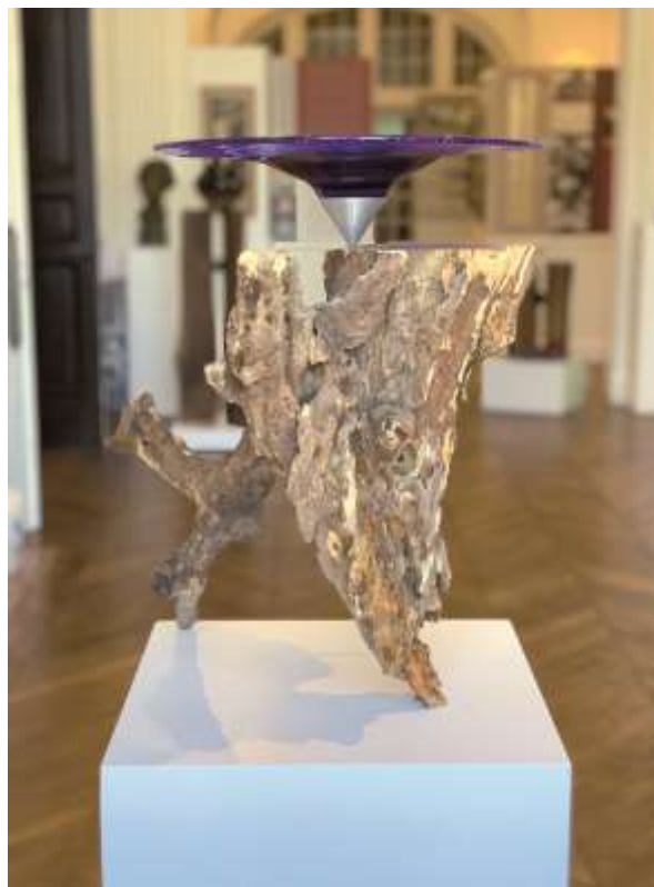
Grand « Racinial » plat - 2020 - Souche d'arbre, aluminium et verre soufflé – 100x40x30cm