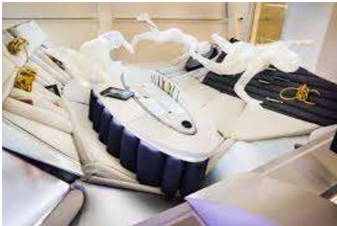
Module spatial pensé par Octave de Gaulle, des coussins permettent de caler les objets et les hommes en apesanteur.