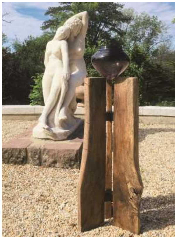
Grand « Cadutaire »-2020 Trépied en noyer et aluminium surmonté d'un vase soufflé d'aspect fissuré – 180x40x40cm