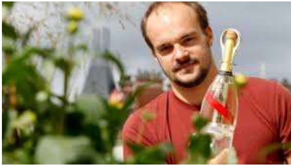
Un champagne pensé pour être dégusté en apesanteur. Mumm